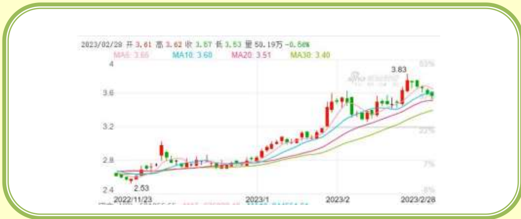
(福田汽车 K 线图，截至 2 月 28 日)