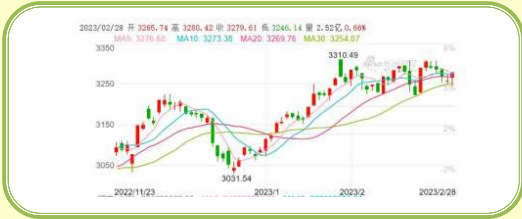
(上证指数 K 线图，截至 2 月 28 日)