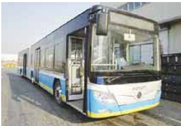
福田欧辉客车 18 米纯电动客车

18 米纯电动公交车在车厢两侧下部和车尾总共设计安装了 11 组电池箱，每组电池重 1 吨多，大小相当于两个手提箱，在换电池时必须使用机械搬运，而且平时使用时要尽量“浅充浅放”，绝不能像传统能源客车那样等柴油快用尽时才加油。