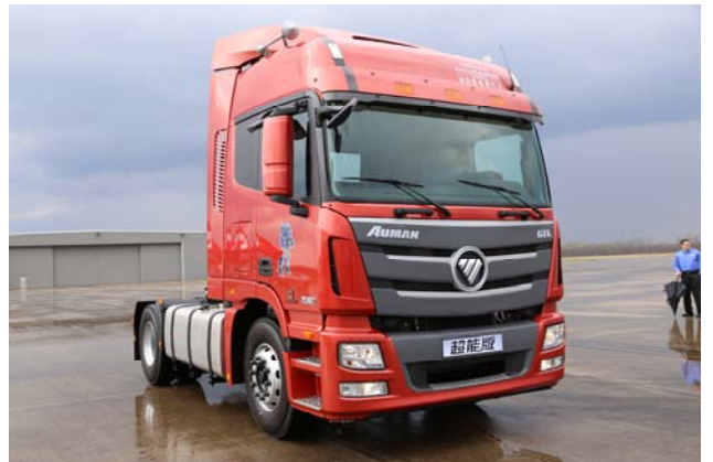
欧曼 GTL 超能版产品

在充分研究和满足全球用户需求的基础上，欧曼 GTL 超能版在低油耗、低运营成本、高安全、高舒适、高出勤率方面实现了 5 大开创性突破，主要以欧 6 产品为主，满足欧盟、北美主流市场需求，同时，拓展巴西、墨西哥、俄罗斯等发展中国家市场，力求在全球高端重卡市场占据一席之地，改变中国和世界重卡的格局。