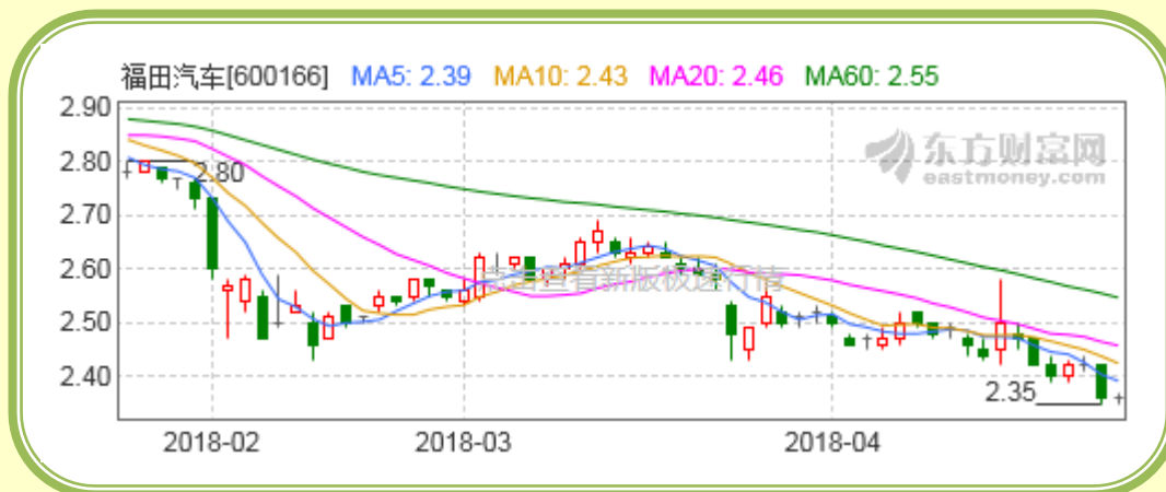
(福田汽车股价走势图，截至 4 月 27 日)