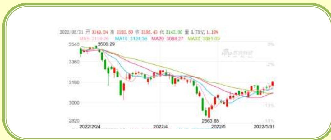
(上证指数 K 线图，截至 5 月 31 日)