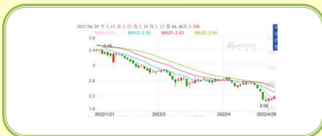
(福田汽车 K 线图，截至 5 月 31 日)