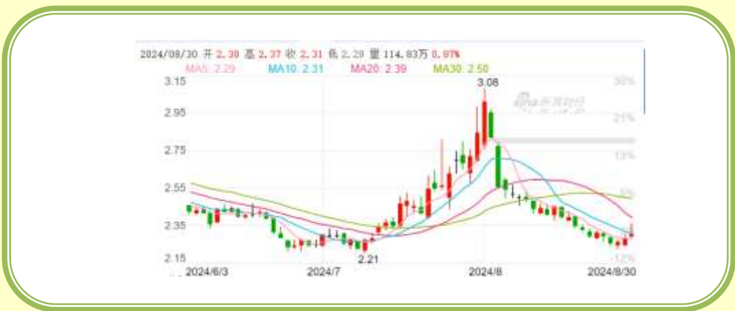
(福田汽车 K 线图，截至 8 月 31 日)