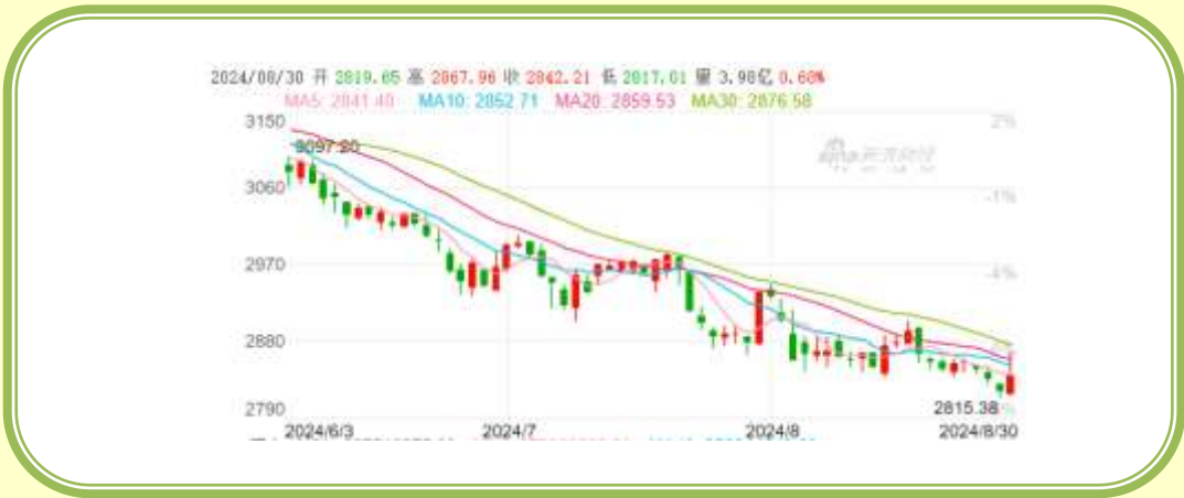
(上证指数 K 线图，截至 8 月 31 日)