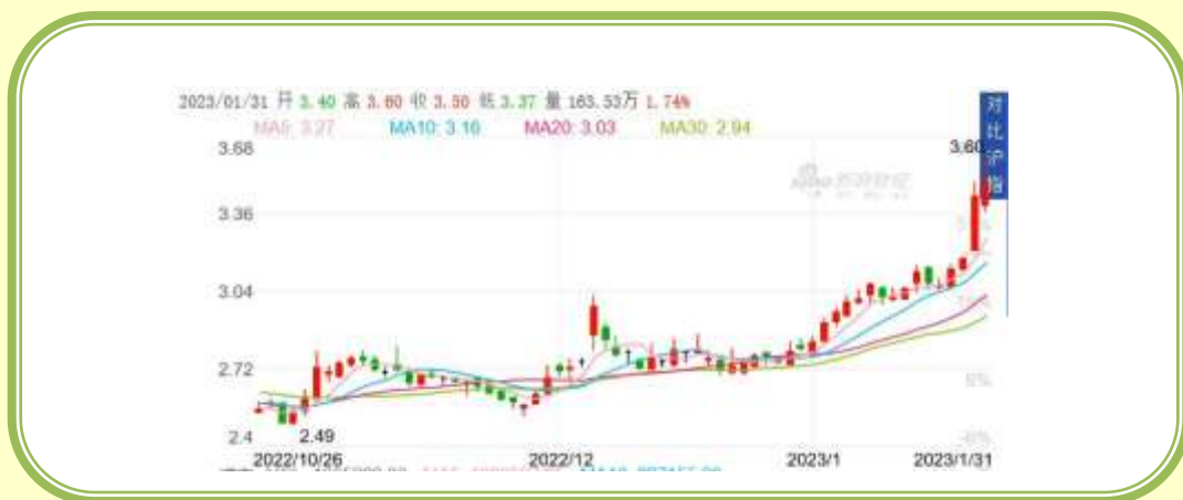
(福田汽车 K 线图，截至 1 月 31 日)