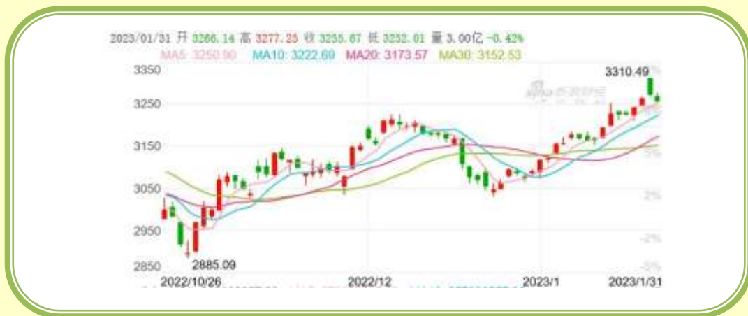
(上证指数 K 线图，截至 1 月 31 日)