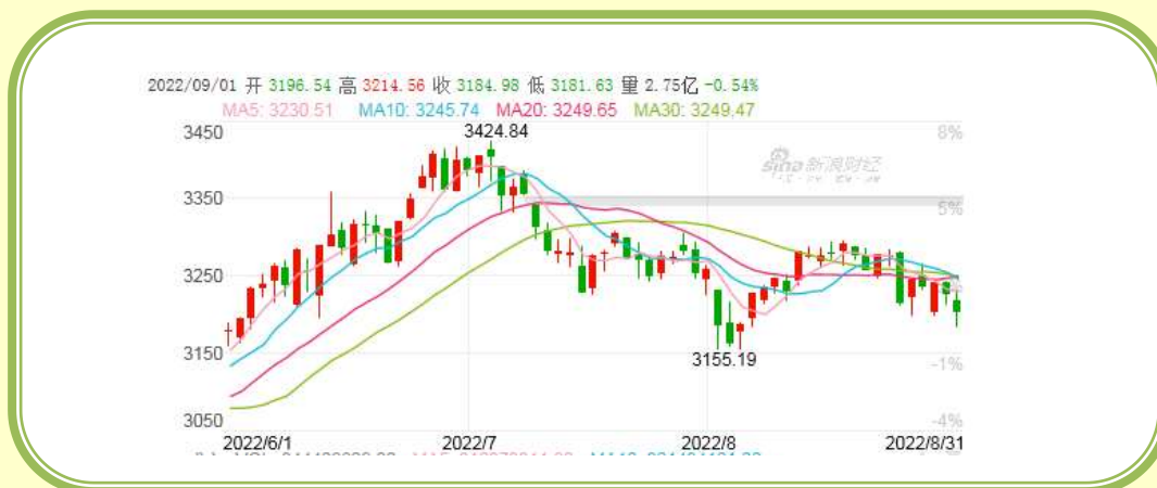
(上证指数 K 线图，截至 8 月 31 日)