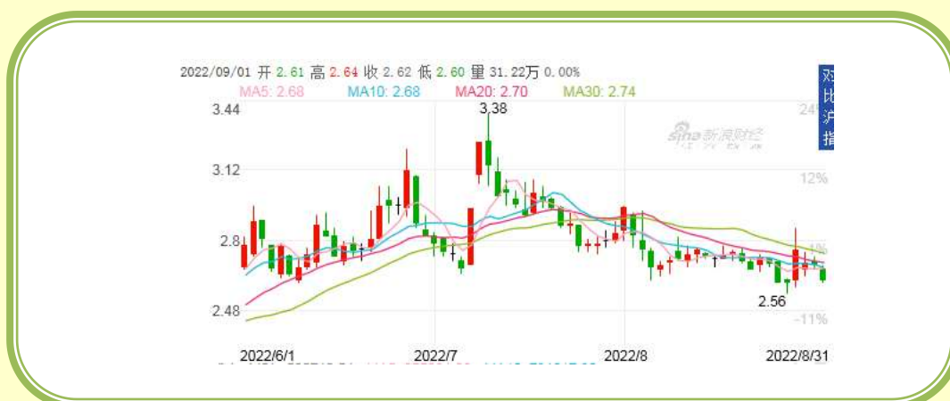
(福田汽车 K 线图，截至 8 月 31 日)